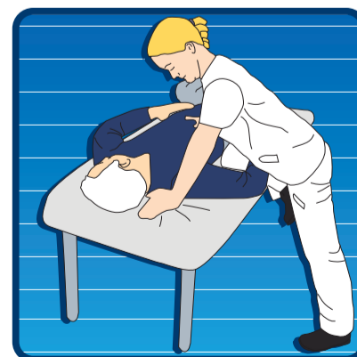
UTILIZACIÓN DE APOYOS