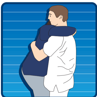
CARGA CERCA DEL CUERPO