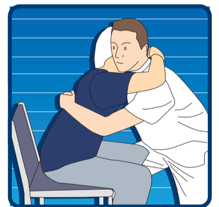
CONTRAPESO DEL CUERPO