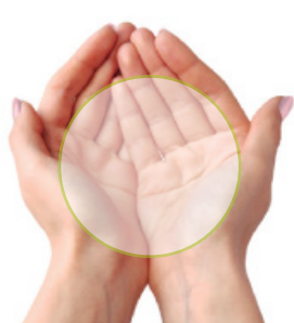
Dos palmas de la mano Cantidad de verduras

La falta de control en las porciones es una de las razones que explican el sobrepeso. Un truco sencillo para evitar el exceso de grasas y calorías es estimar las porciones diarias que cada persona necesita en función de la propia mano.