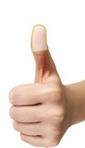
La punta del pulgar Cantidad de aceite diario