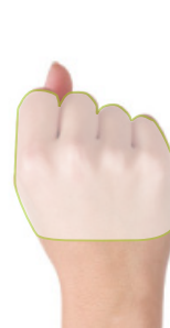
Un puño Cantidad de fruta