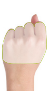
Un puño Cantidad de pasta, arroz o legumbres cocidas