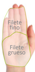
Palma de la mano Cantidad de carne y pescado